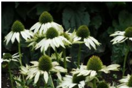
Foto-Spaziergang zu den Staudenbeeten

Im Westfalenpark gibt es neben den bekannten Rosenarten eine große Vielfalt an farbenprächtigen Zierstauden zu bewundern.