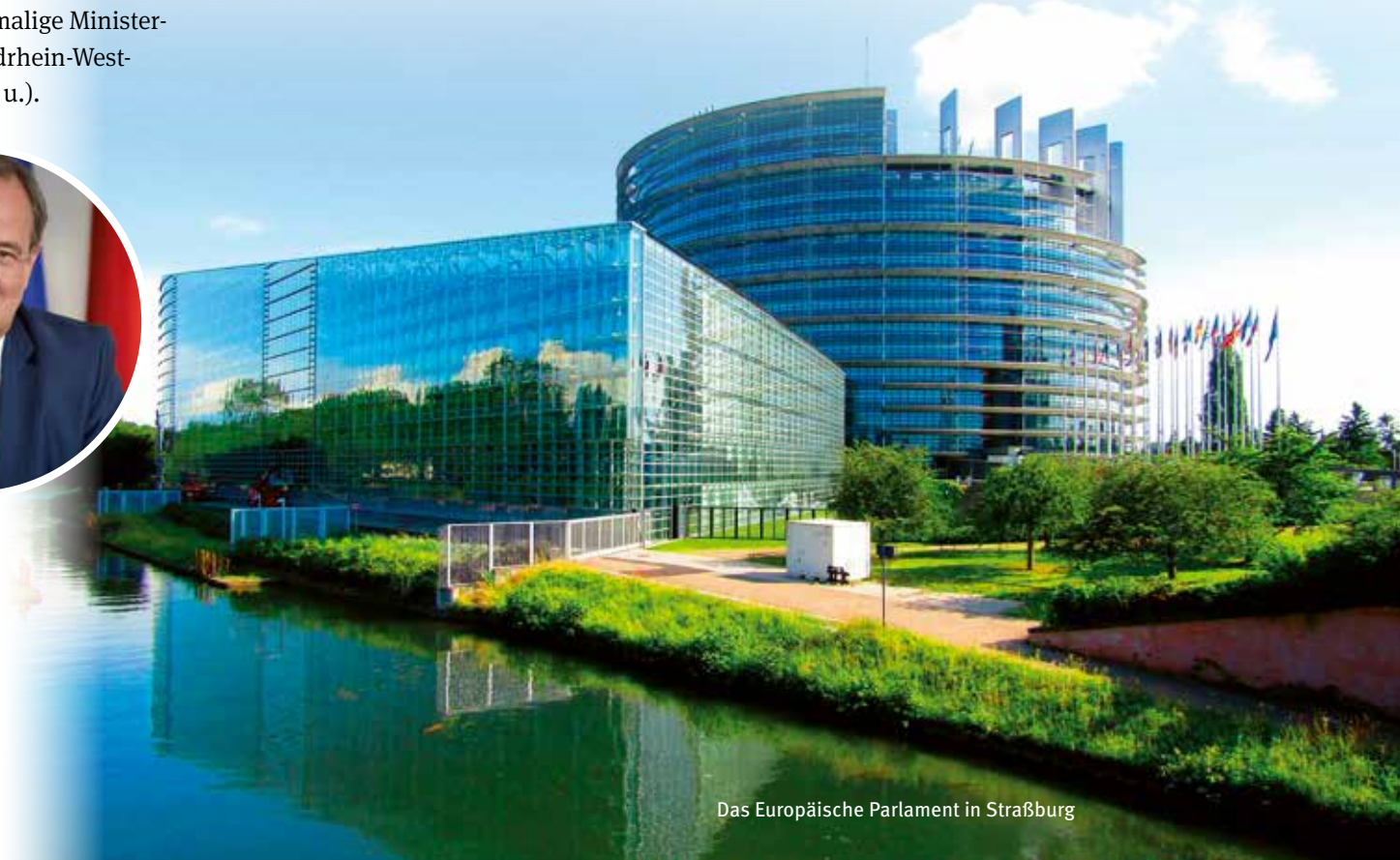
Das Europäische Parlament in Straßburg

Die Veranstaltung ist geladenen Gästen vorbehalten.