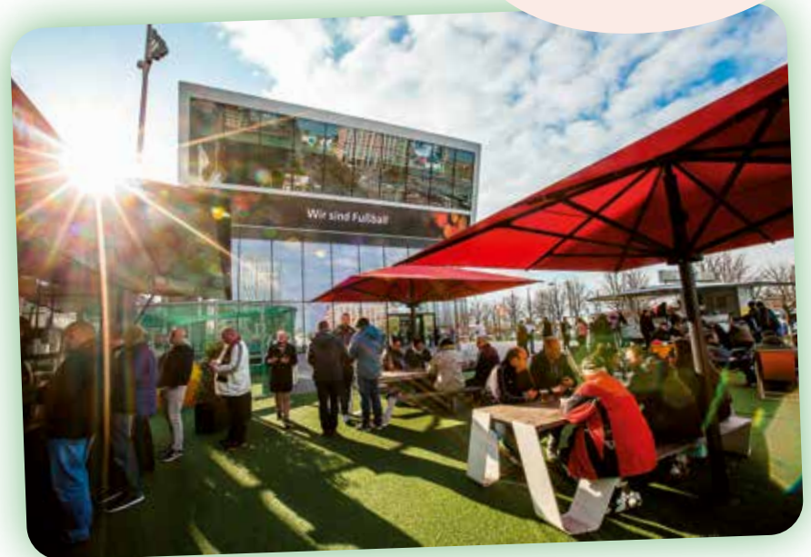
Kochen am Fußballmuseum in Dortmund

Die Teilnahme ist kostenpflichtig, beinhaltet sind Probiertationen der einzelnen Gerichte. Neben der Auslosung informieren wir im Internet und in unseren Publikationen zeitnah über den genauen Programmablauf.