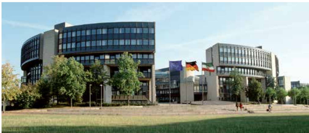
Der Landtag Nordrhein-Westfalen in Düsseldorf

im Landtag Nordrhein-Westfalen, Platz des Landtags 1, 40221 Düsseldorf