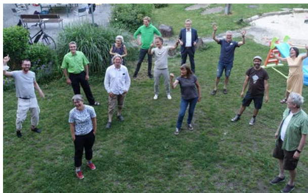
Gründungsmitglieder der Lokalgenuss eG

haben seit Jahren zu keiner Änderung der Landwirtschaftsstruktur in Dortmund geführt. Wir werden das ändern, indem wir aktiv am Lebensmittelmarkt auftreten. Wir wollen im Namen von unseren Mitgliedern auf die Dortmunder Landwirte zugehen und sie zu einer Produktion von Lebensmitteln für uns auffordern. Da wir den Großhandel übergehen, können wir für und Verbraucher und für die Landwirten attraktive Preise bieten. Unsere Nachfrage soll also das Angebot hervorrufen und anschließend dafür sorgen, dass diese Lebensmittel zunehmend nachhaltiger produziert werden.